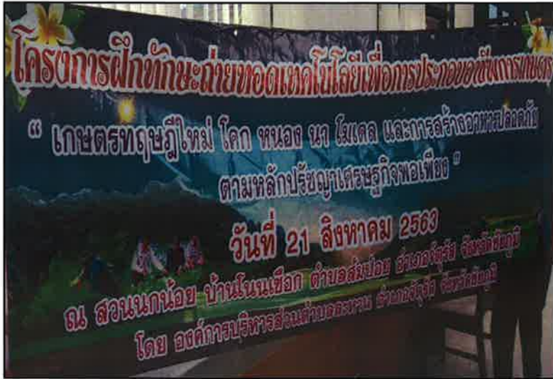
ป้ายโครงการ