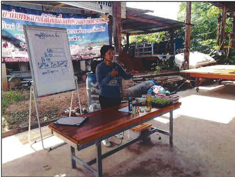
ฟังบรรยายจากวิทยากร