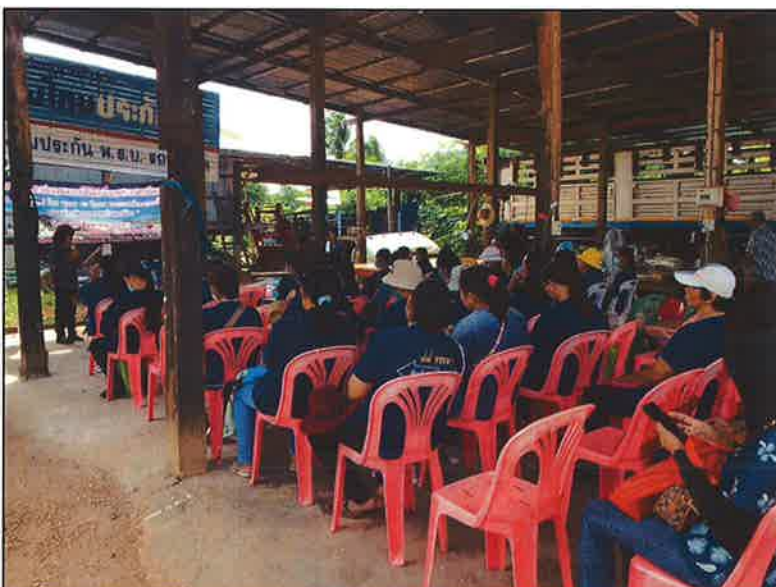
กล่าวเปิดการฝึกอบรม โดย นายก อบต.ละหาน