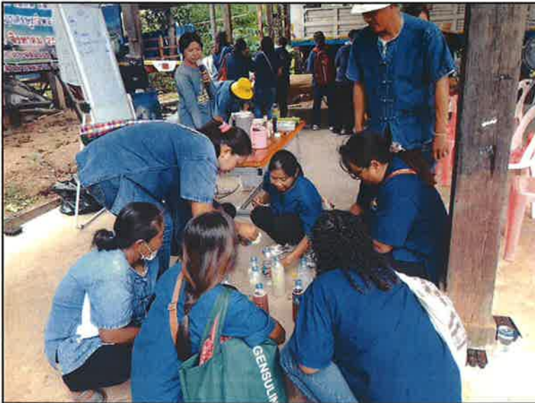
ฝึกปฏิบัติ