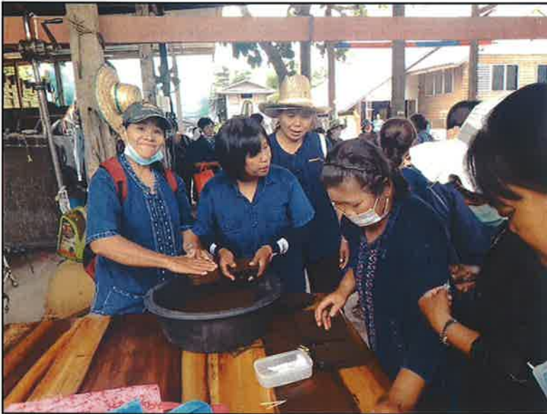
ฝึกปฏิบัติ