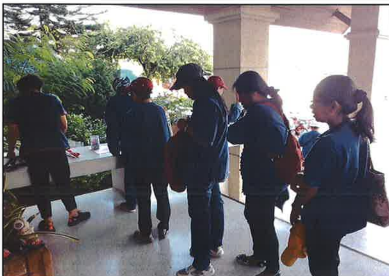
ลงทะเบียน