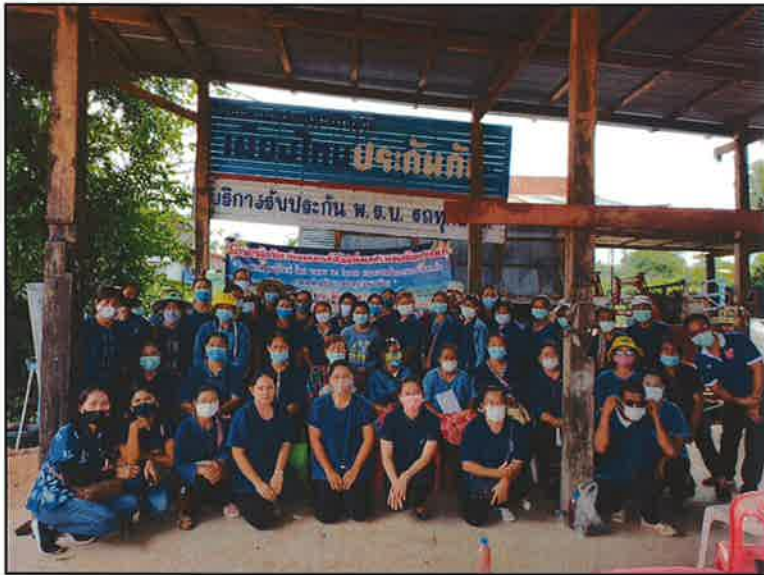
ปิดการฝึกอบรม