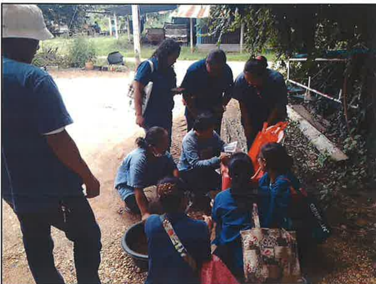
ฝึกปฏิบัติ