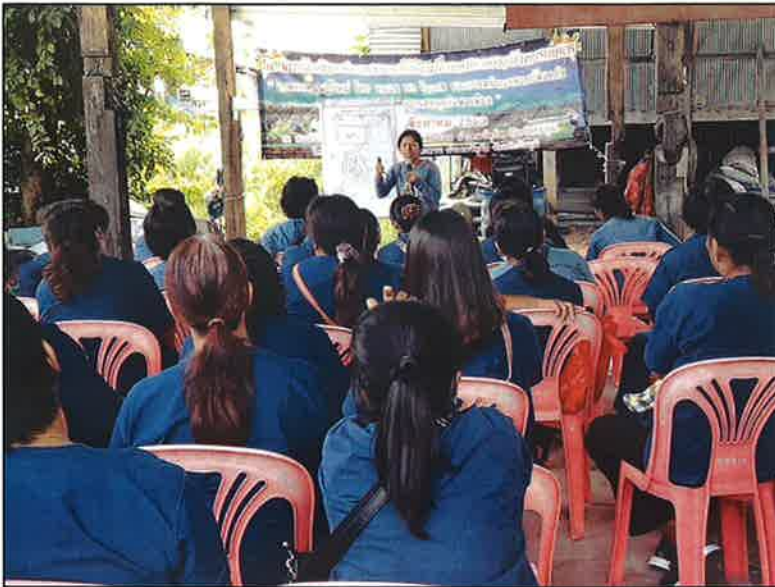
ฟังบรรยายจากวิทยากร