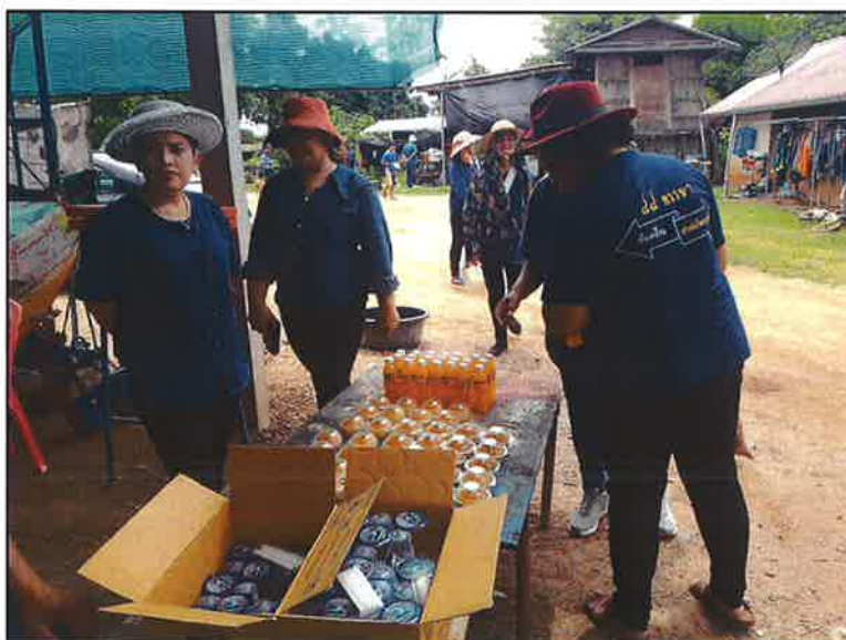
พักรับประทาน อาหารว่าง