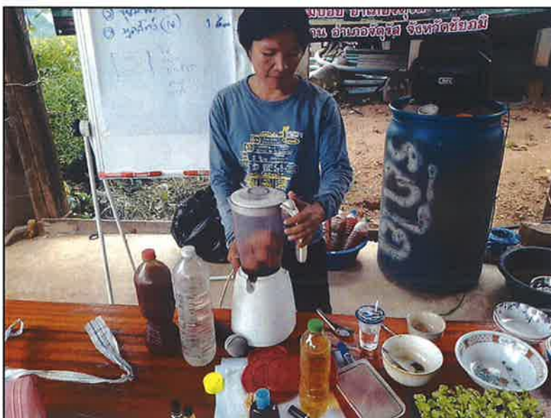
สาธิตการทำจุลินทรีย์ สังเคราะห์แสง