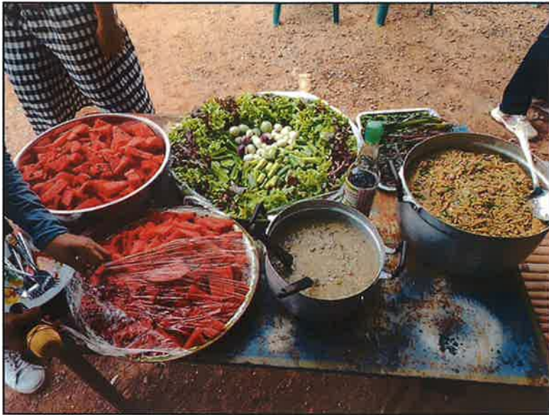
พักรับประทานอาหาร กลางวัน