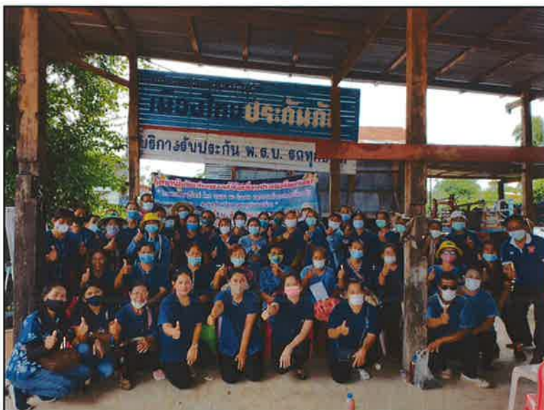
ปิดการฝึกอบรม