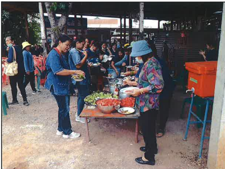
พักรับประทานอาหาร กลางวัน