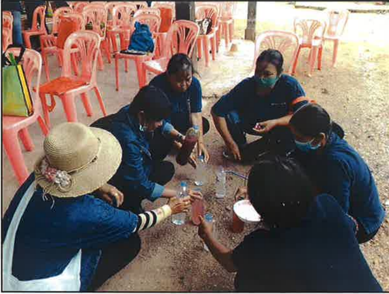
ฝึกปฏิบัติ