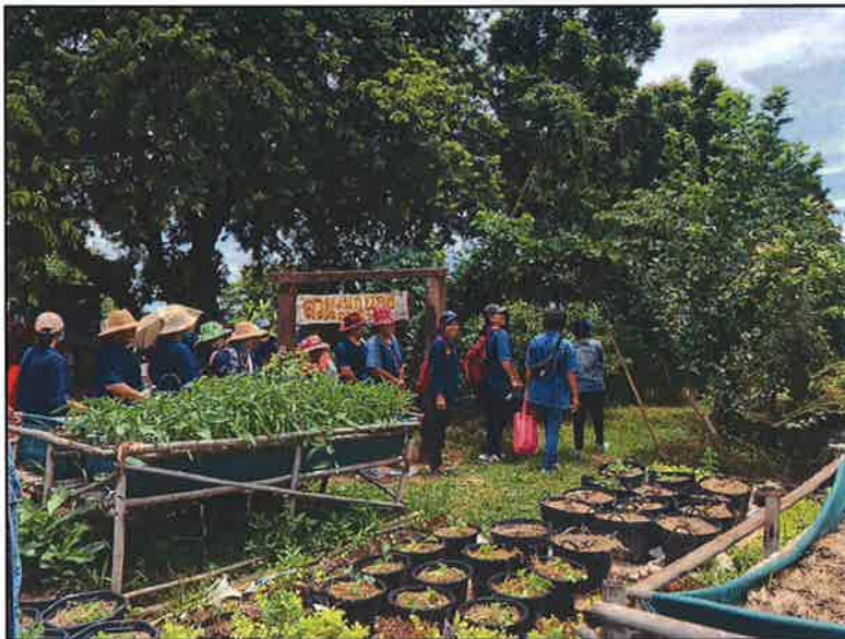
ชมแปลงสาธิต ๑ ไร่ ๔ พอ