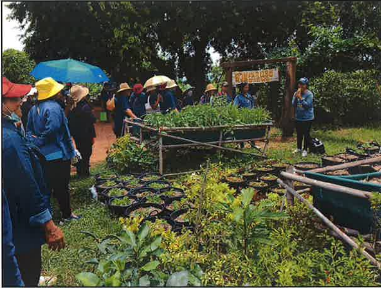
ชมแปลงสาธิต ๑ ไร่ ๔ พอ