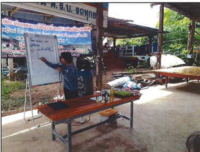
ฟังบรรยายจากวิทยากร