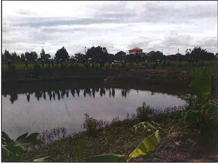
ชมแปลงสาธิต โคกหนองนาโมเดล ๕ ไร่ ๔ พอ