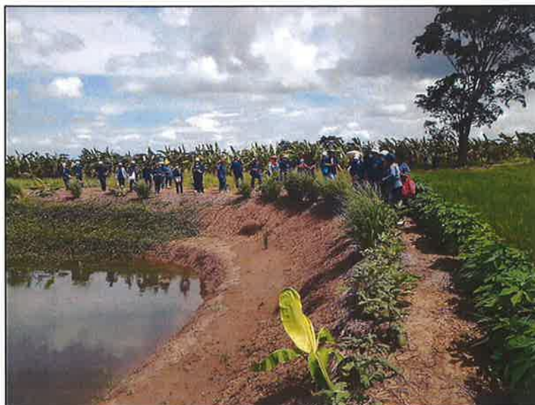
ชมแปลงสาธิต โคก หนอง นา โมเดล ๕ ไร่ ๔ พอ