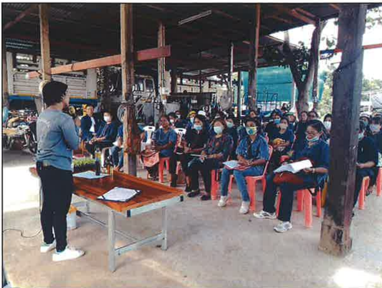
ฟังบรรยายจากวิทยากร