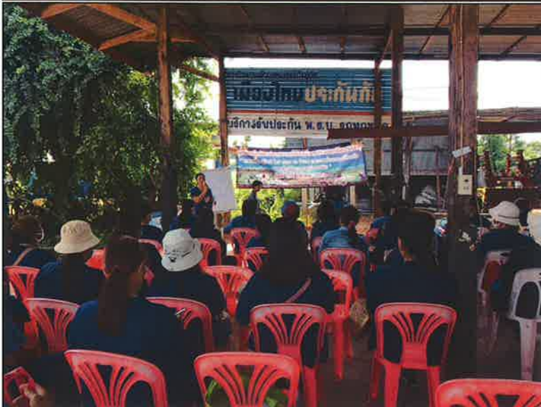
ถึงสถานที่อบรมและ ศึกษาดูงาน