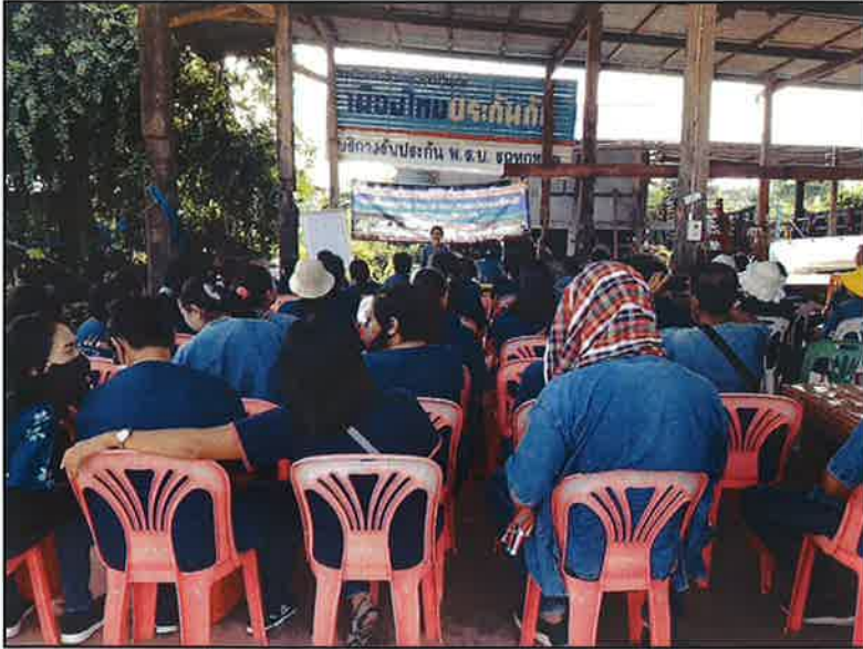
ฟังบรรยายจากวิทยากร