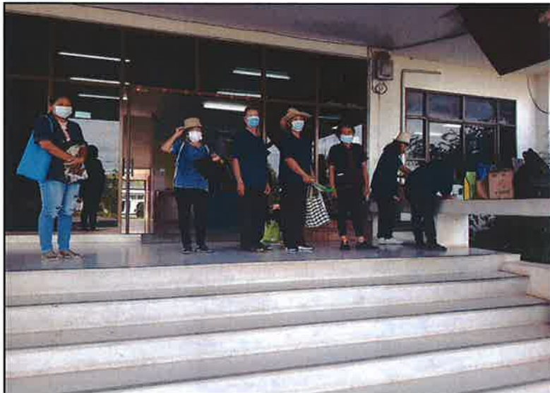
ลงทะเบียน