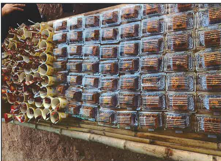
พักรับประทานอาหาร ว่าง