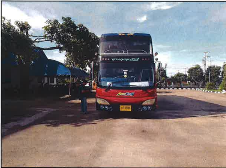
ออกเดินทางไปยังสถานที่ อบรมและศึกษาดูงาน